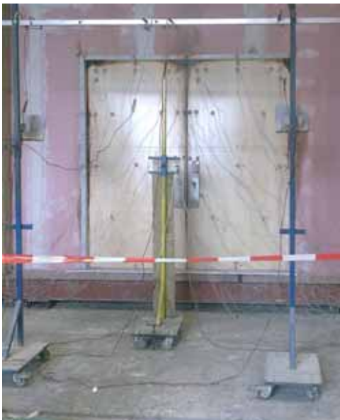
Getest volgens EN 1634-1:2000

De HLS-catch is een temperatuurpal waarbij de pen in "ruststand" opgesloten is. Deze loopt pas uit als de omgevingstemperatuur tot aan ca. 600°C stijgt ( de HLS-catch heeft dan een temperatuur van ca. 65°C). Hierdoor wordt de deur gefixeerd en dit voorkomt het kromtrekken en daardoor het ontstaan van vuur doorlatende aansluitnaden tussen de dubbele deuren of de deur en het kozijn. Dit uitlopen vindt plaats voor het uitzetten van het opschuimend materiaal.