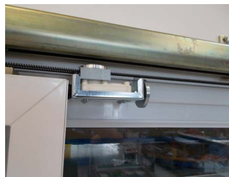
Schiebetürschließer mit Freilauffunktion: Im Alarmfall schließt der Mitnehmerwagen die Tür