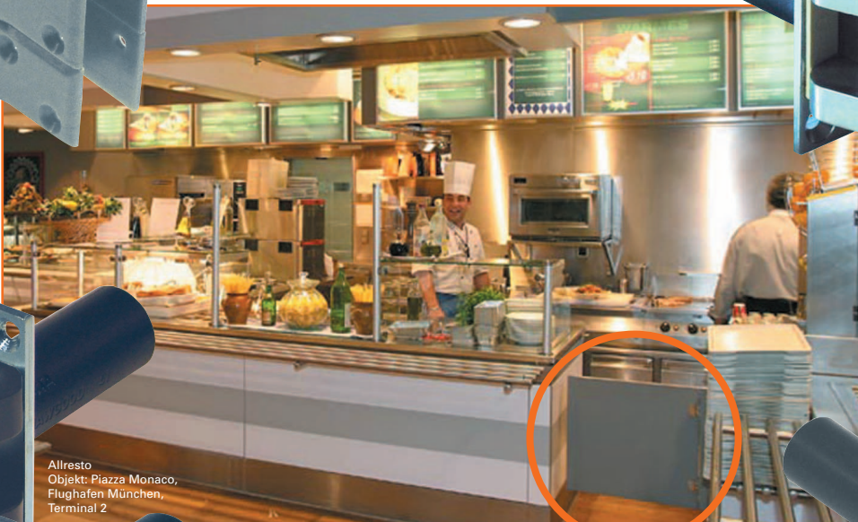
Allresto Objekt: Piazza Monaco, Flughafen München, Terminal 2